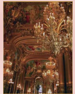
オペラ座

一度、国際社交術を身につけてしまえば、あなたの世界は更に大きく広がっていきます。旅の帰路に、素敵に変身したご自身にきっと驚かれることでしょう。